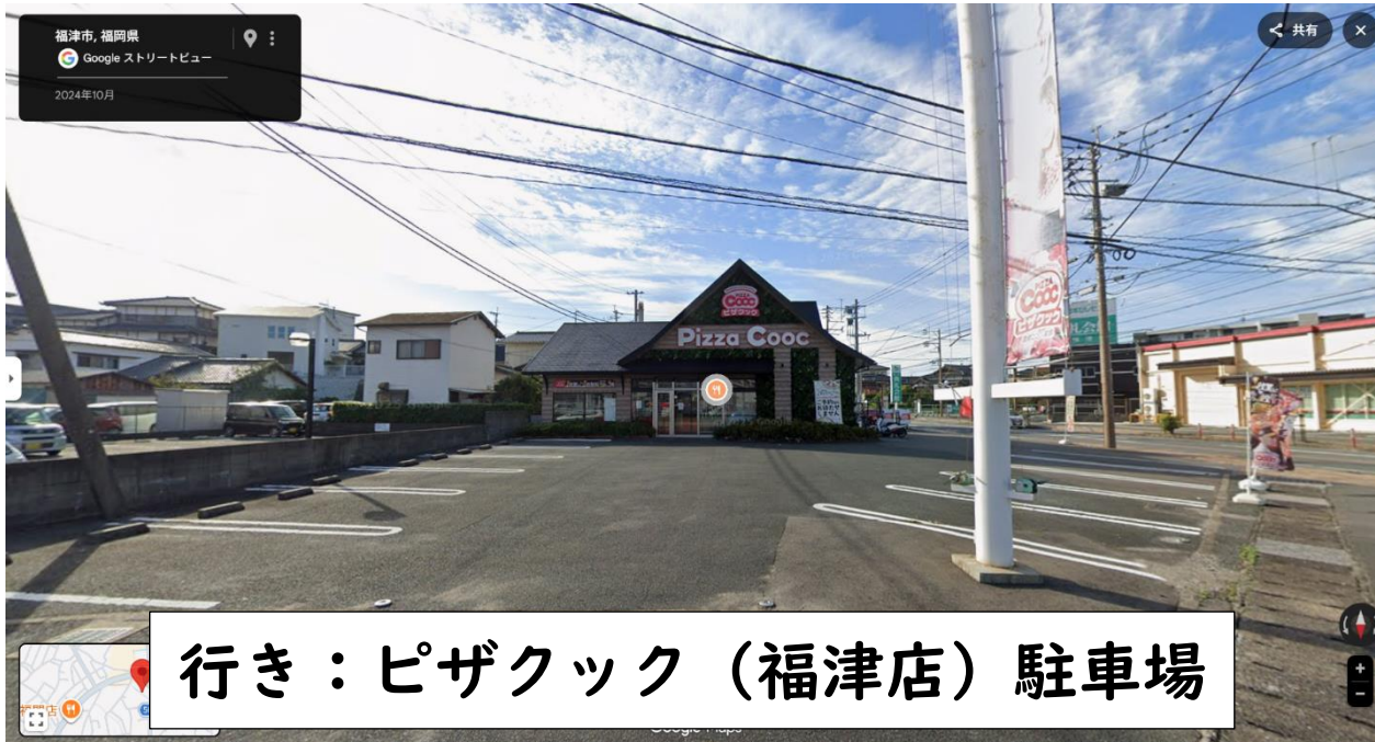
行き：ピザクック（福津店）駐車場