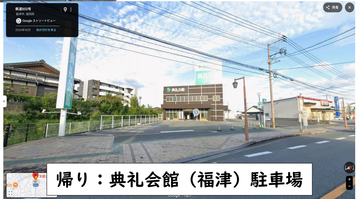
帰り：典礼会館（福津）駐車場